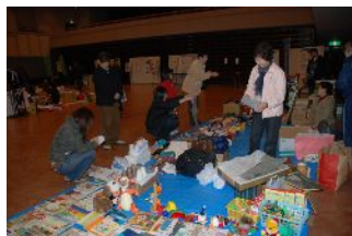
《フリーマーケット》