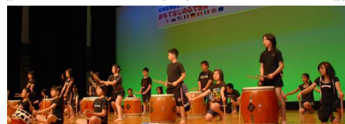
《ステージ部門『輝く響きの夕べ』》